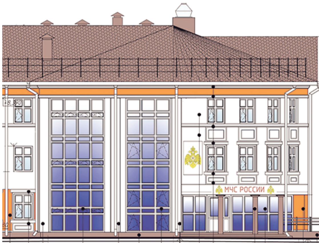
Фрагмент проекта нового здания Главного управления