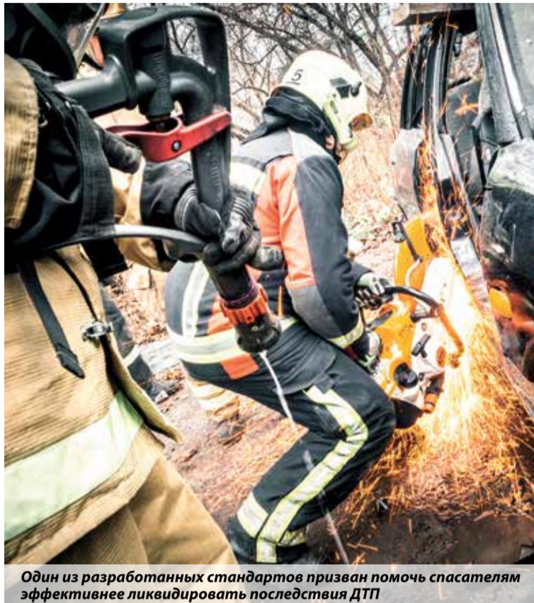
Один из разработанных стандартов призван помочь спасателям эффективнее ликвидировать последствия ДТП

Актуальность ГОСТа более чем очевидна: как прави-