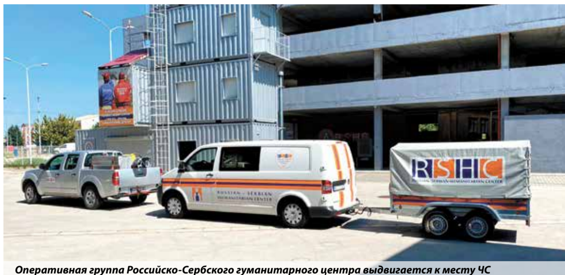
Оперативная группа Российско-Сербского гуманитарного центра выдвигается к месту ЧС

В настоящее время ситуация около населенных пунктов Босилеград и Равни Дел остается сложной. Для координации действий служб, задействованных в ликвидации пожара, развернут штаб пожаротушения. Задействованы две единицы тяжелой техники, две пожарные цистерны,